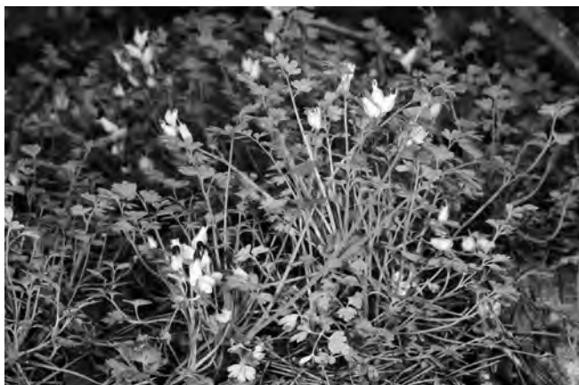
Figura 1. Fumaria macrosepala , planta sencera, serra del Reclot, L. Serra.

Al camp fem servir el GPS del Smartphone amb l'aplicació Oruxmaps© i després hem contrastat les coordenades amb la fotografia aèria del visor de la Generalitat Valenciana ( http://visor.gva.es/visor/ ). Oferim les dades amb el DATUM ETRS89, que és l'oficial a l'Estat Espanyol des de 2007 (Anònim, 2007), però també oferim la quadrícula UTM d'1 km 2 en el DATUM ED50 per homogeneitzar amb les dades que figuren a la nostra base de dades des d'els anys 80 del segle passat. Les dades biogeogràfiques i bioclimàtiques segueixen bàsicament a Rivas Martínez et al. (2007) i Serra (2007).