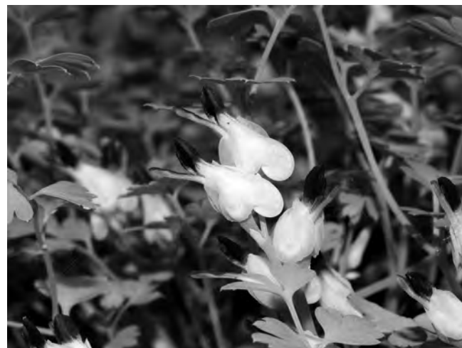
Figura 2. Fumaria macrosepala , detall de les flors, serra del Reclot, L. Serra.

La població de Monòver s'identifica clarament pels seus amples sèpals que oculten part de les flors, que són blanques, tacades de púrpura a la zona apical (Figs. 1-2); no és